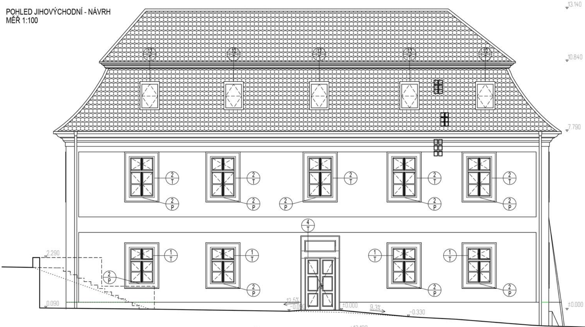
POHLED JIHOVÝCHODNÍ - NÁVRH MĚR 1:100